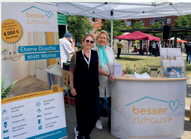
Ob Umbau, digitale Technik, finanzielle Förderungen und mehr, „besser zuhause“ berät rund um ein barrierefreies Wohnen.