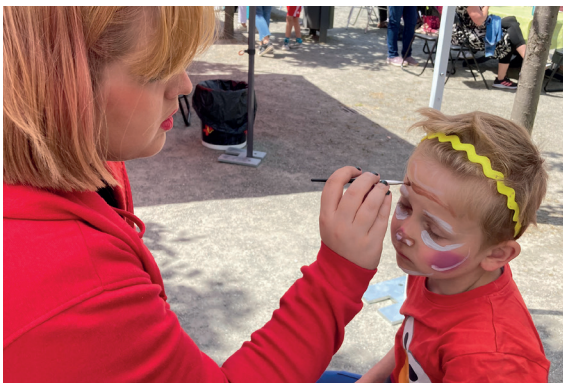
Beim Schminken, da hält man doch gern mal still.

Das Fest war voller Informationen, Aktivitäten und Attraktionen für „Jung und Alt“. Für Erwachsene standen die Themen „Sicherheit und Mobilität“ im Mittelpunkt. Bei den Kindern standen Umweltbewusstsein, Kreativität, Spaß und Spiel im Vordergrund. Auch für das leibliche Wohl war mit Grillwürsten und Räucherfisch bestens gesorgt. Und die Band „Saints In Action“ ‚buhlte‘ mit ihrer schmissigen Countrymusik mit dem fabelhaften Wetter um die Gunst des Publikums. Da war ordentlich was los auf dem Marktplatz „Käkenhof“. Schauen Sie mal selbst.