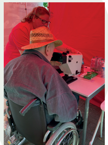
Sehtest beim Automobil-Club „ACE“