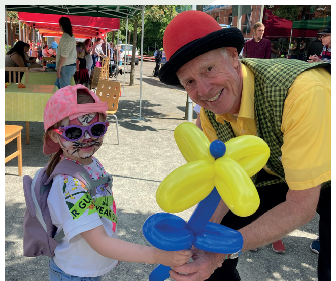
Im Mega-Outfit mit dem Zauberünstler gemeinsame Sache machen.