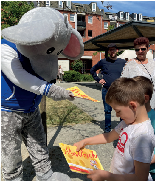
Maskottchen „Manni“ von der HASPA verteilt Malbücher an die Kleinen. Die Großen können sich am Info-Stand rund um das Thema Online-Banking informieren.