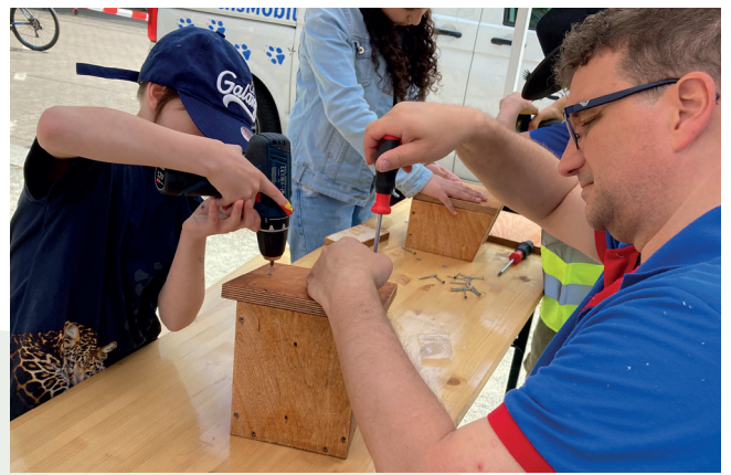
Ein Zuhause für heimische Vogelarten. Kinder helfen ihren gefiederten Nachbarn. Unter professioneller Anleitung lernen sie, Nistkästen zu bauen.