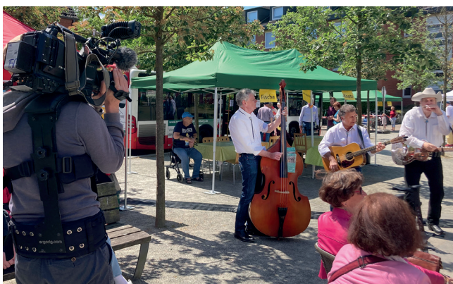
„Noa4“ filmt die tolle Band „Saints In Action“.